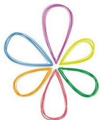
Tableau de référence pour les enfants en âge scolaire